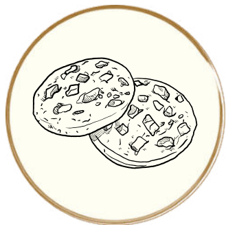
Biscotti Dolci e Salati