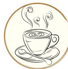
Bevande al Cacao