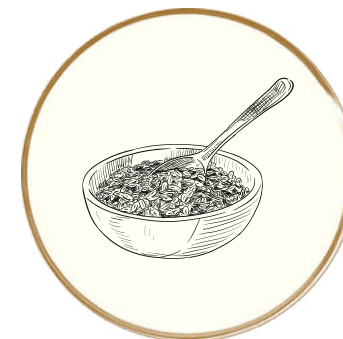
Granole ispirate ai Chakra